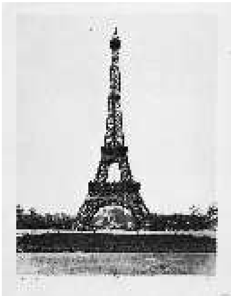
La tour EIFFEL